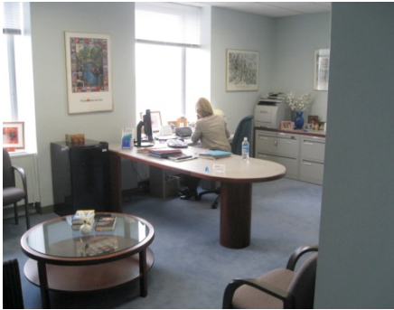
La Gerente General de la OSG Trabajando

nes por la mañana varios de los delegados de la Región del Pacífico tomaron el tren hacia la ciudad para visitar las oficinas de la OSG y el Grapevine/ La Viña en el 475 Riverside Drive.